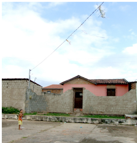
Imagem 03: Pipas: fontes de perigo e alegria em Bodocongó

Outra brincadeira comum, no bairro de Bodocongó, é a de empinar pipas, que frequentemente enrolam-se nos fios de alta tensão, trazendo riscos para as crianças que as confeccionam. Uma rápida olhada para o céu que cobre o bairro, dá-nos uma ideia da quantidade de pipas que diariamente se perdem no cotidiano lúdico das crianças de Bodocongó.